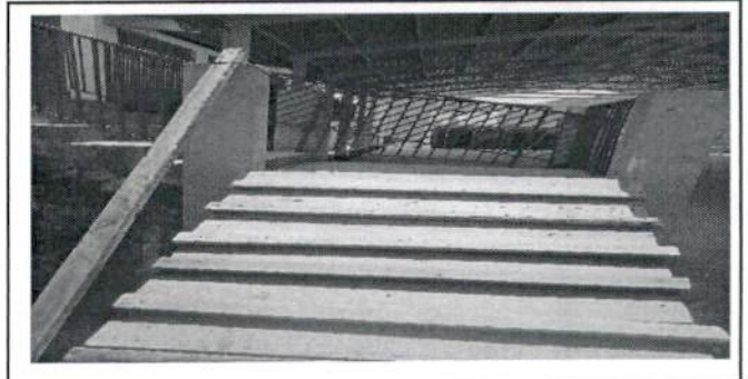
Foto 6: Área donde se realizará la Reparacion de barandas de metal

Observación: Si es necesario se pueden agregar hojas adicionales y actualizar el número de hojas.